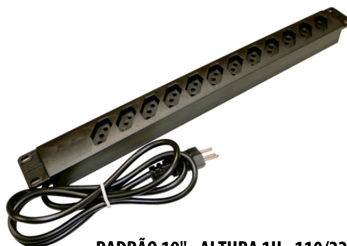
PADRÃO 19" - ALTURA 1U - 110/220